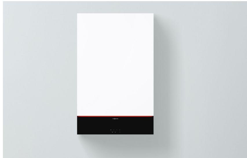
Vitodens 100-W nuovo design e colore Vitopearlwhite

Vitodens 100-W è una caldaia murale a condensazione a gas con un rapporto qualità/prezzo molto interessante. Grazie alla accessibilità frontale di tutti i componenti interni, al peso ridotto e alla silenziosità, si integra facilmente in qualsiasi appartamento e abitazione mono- o bifamiliare. La caldaia è dotata di display LCD a 7 segmenti e 4 tasti touch con pannello nero frontale su tutta la larghezza di caldaia. È possibile la gestione di un circuito diretto e/o un circuito miscelato.